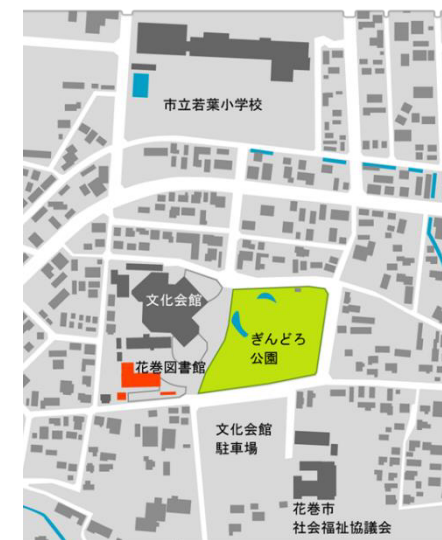
図2 現花巻図書館の位置